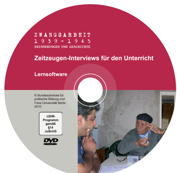
Lernsoftware „Zeitzeugen-Interviews für den Unterricht“, 2011 (Freie Universität Berlin, Center für Digitale Systeme)